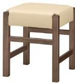
Frame / ダークブラウン