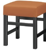
Frame / ブラック