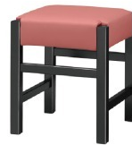
Frame / ブラック