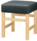
Frame / ナチュラルクリヤ