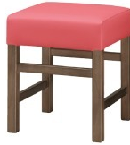
Frame / ダークブラウン