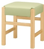
Frame / ナチュラルクリヤ